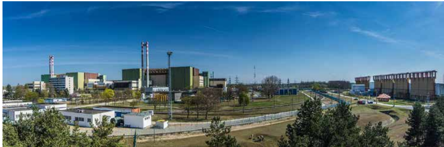
A Paksi Atomerőmű a Kiégett Kazetták Átmeneti tárolójának szomszédságában

Életünk velejárója a hulladéktermelés. Nincs ez másként a radioaktív hulladékok esetében sem. Számos orvosi, ipari, mezőgazdasági és egyéb kutatási tevékenység során radioaktív anyagokat használnak fel. A nukleáris alapon termelt villamos energia természetes velejárója a kiégett fűtőelem és a folyamat során keletkező - különböző aktivitású - radioaktív hulladék, amelynek elhelyezéséről gondoskodnunk kell.