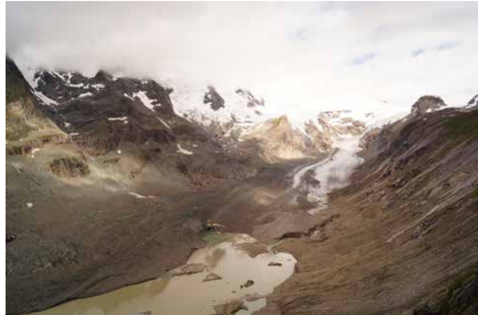
A klímaváltozás a gleccsereket is súlyosan veszélyezteti. A képen az ausztriai „visszavonuló” Pasterze-gleccser látható 2021. augusztus 2-án.

Az ENSZ Éghajlatváltozási Kormányközi Testülete, az IPCC legfrissebb, augusztus elején publikált jelentése sokkoló üzeneteket fogalmaz meg a döntéshozók és végeredményképpen az egész emberiség számára. Egyértelműen rámutat, hogyha nem történik azonnali, gyors és nagymértékű csökkentés az üvegházhatású gázok kibocsátásában, akkor a globális felmelegedés közel 1,5°C-ra vagy akár 2°C-ra történő korlátozása elérhetetlen lesz. A tanulmány azt is egyértelműen kijelenti, hogy a klímaváltozás hatásai már világszerte megfigyelhetők. De van hely a reménynek és a félelemnek is.