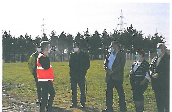
Az ellenőrző Bizottság tagjai 2020. október 27-én Pakson