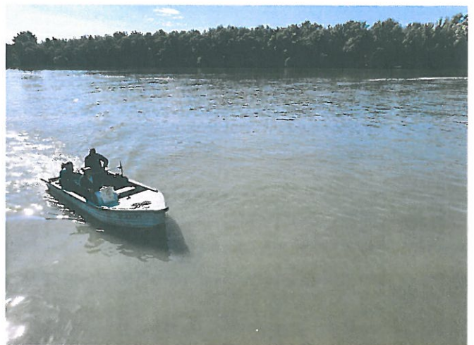
Az ellenőrzés 2020. október 6-án a Duna paksi szakaszán

A harmadik látogatás a Radioaktív Hulladékokat Kezelő Kft. Kiegészített Kazetták Átmeneti Tárolójában (KKÁT) történt. Az Ellenőrző Bizottság a látogatás keretében megtekintette a KKÁT bővítési munkálatait. Az RHK Kft. munkatársai tájékoztatták a bizottság tagjait a jelenleg zajló bővítési munkálatokról, az építkezés aktuális feladatairól. A bizottság tagjai meggyőződtek az építkezésről, valamint tájékoztatást kaptak a létesítmény bővítésének határidejéről, és a további moduláris bővítésének lehetőségéről.