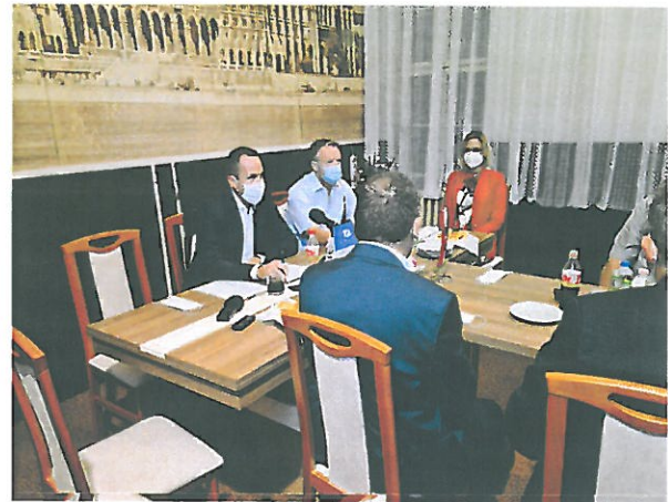
Társulási Tanács ülés Dunaszentgyörgyön 2020. szeptember 23-án

A 2020 évben társulásunknak nem volt lehetősége külföldi tapasztalatszerzésre a pandémiás helyzet okán, azonban a szakami tapasztalatokat az európai atomerőművek körüli önkormányzatokat (társulásokat) tömörítő szervezet (GMF) online konferenciáján részt vettünk. Valamint az orosz partnerszervezetünkkel is online tapasztalatcserére került sor.