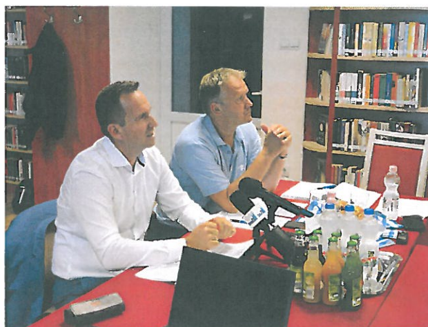
Társulási Tanács ülés Dunaszentbenedeken 2020. július 21-én