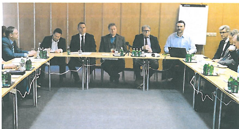
A Társulás 2020. januári tájékoztatója

Társulásunk az idei különleges évben január 10-én ülésezett először, amely ülésen beszámolt az előző évi tevékenységéről, és tájékoztatást kapott az MVM Paksi Atomerőmű vezetésétől közvetlenül.